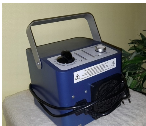
UV lampa a generátor ozonu

Drobné změny proběhly ve voliéře – nové wc v plastové psí boudě v zadní části voliéry umožňuje pohodlnější používání i velmi plachým kočkám, které jinak s potřebou čekaly, až útulek opustí všichni lidé. Podél plotu bylo na zeminu položeno linoleum, které se jednodušeji uklízí a také jsme nechali ušít novou střešku houpačky, kterou si hlavně koťata oblíbila jako skluzavku a tak ji potrhala. Od léta si také každý večer hrajeme na Vánoce díky novému osvětlení, které umožňuje uklízet i za tmy, ale neruší ani bojácné kočky.